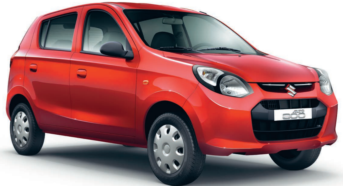
Fotografía corresponde al Suzuki Alto GLX.