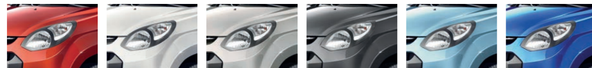
Rojo Blanco Plata Gris oscuro Azul Azul turquesa