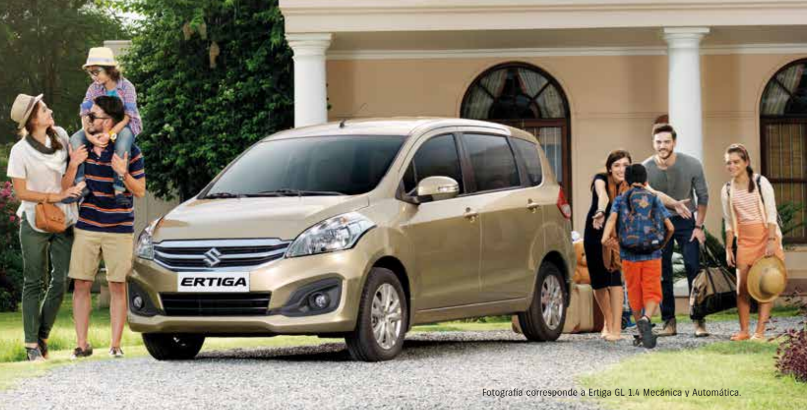
Fotografía corresponde a Ertiga GL 1.4 Mecánica y Automática.