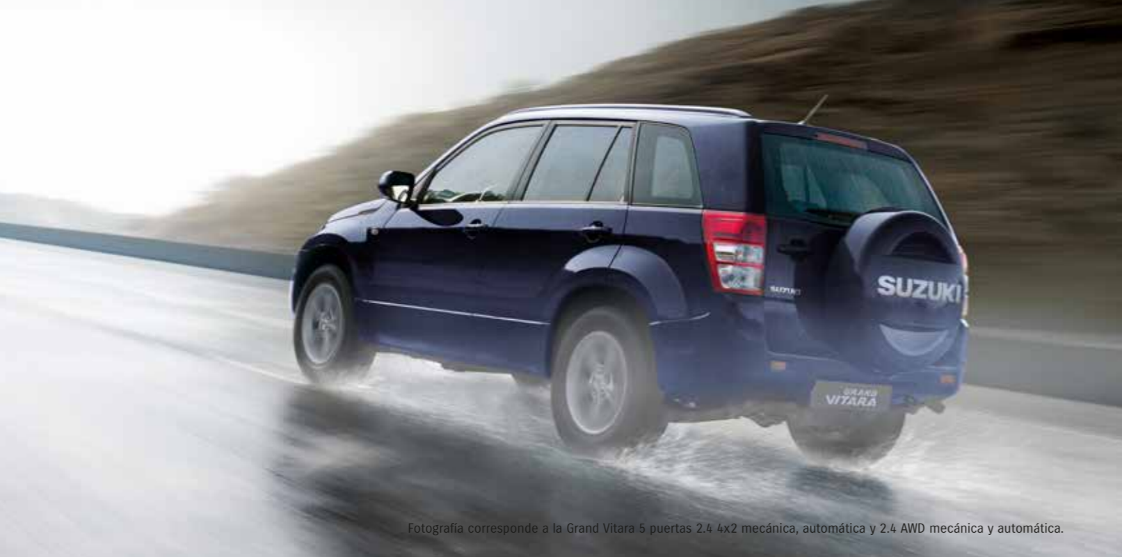
Fotografía corresponde a la Grand Vitara 5 puertas 2.4 4x2 mecánica, automática y 2.4 AWD mecánica y automática.