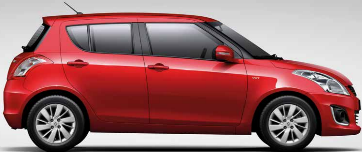
Fotografía corresponde al Swift Live M/T y A/T.