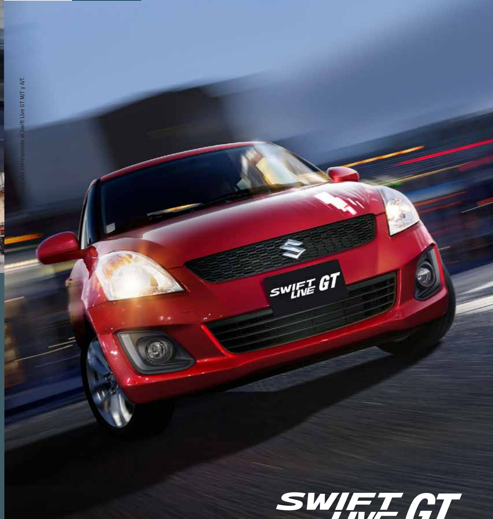
Fotografía corresponde al Swift Live GT M/T y A/T.