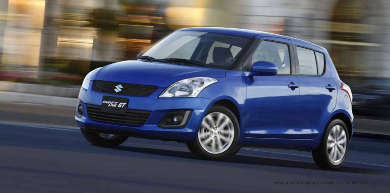
Fotografía corresponde al Swift Live GT M/T y A/T.