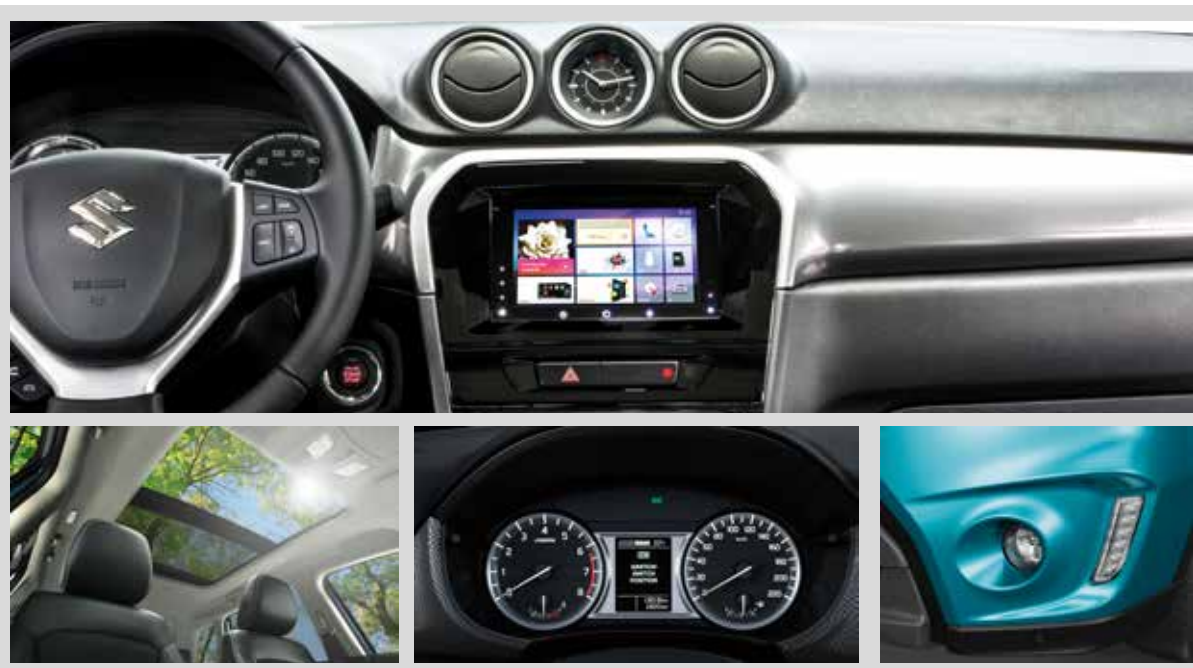
Las fotografías corresponden a la versión Vitara Live GLX+