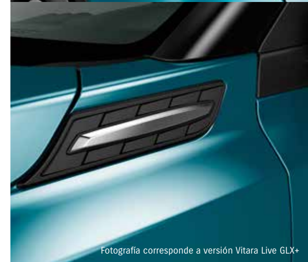
Fotografía corresponde a versión Vitara Live GLX+

Celebramos las cosas buenas que llegan a nuestra vida, por eso ahora celebremos la llegada de la Vitara Live.